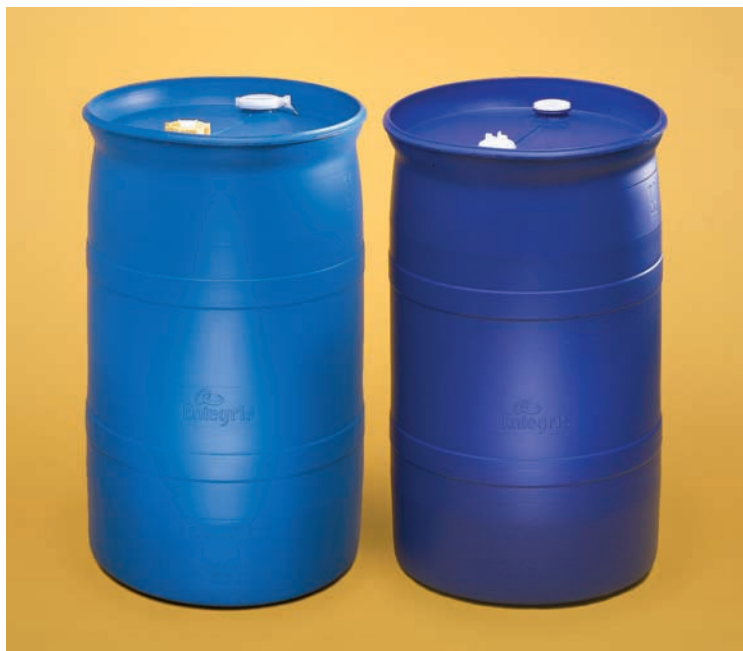
貴重な素材品質保持のためアジア/大太平洋地域向けに設計されたインテグリスの FluoroPure® Trilayer および Advantage Trilayer HDPE ドラムが薬液の純度を確保します。

また、標準的なクイック コネクト システムに加えて、一方向式または多用式アプリケーションに最適な Sentry™ シングルクイック コネクト システム (SLQC) も提供しています。インテグリスが特許を取得した Flaretek® テクノロジーに基づくこの接続システムは、薬液のキーコード化を行うことなく、Oリング不要の供給およびベント接続が可能となります。