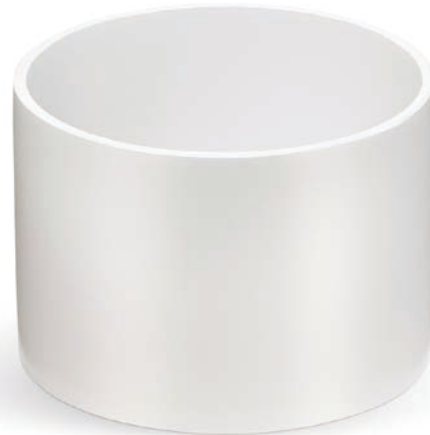
NA-46-250 SHIPPING RING

NA-46-250 SHIPPING RINGは、NOWPak®(ナウパック) ボトルを充填して同クロージャーで密閉した後に、クロージャーの上に装着するものです。このSHIPPING RINGは、米国運輸省 (DOT) および国連 (UN) 規格で薬液搬送時に装着を義務づけられているもので、充填したナウパックボトルの搬送時に使用します。