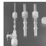
アダプターセット