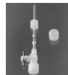
エアベントセット