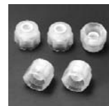
フェールルナット